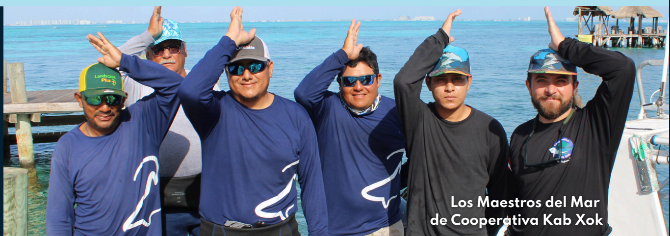
Los Maestros del Mar de Cooperativa Kab Xok

SHARK S A F A R I ISLA MUJERES SHARK INITIATIVE